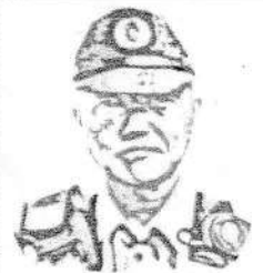
作成者 山口 巡査長