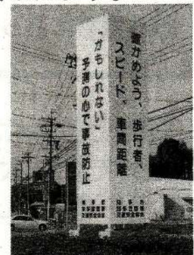
▲ 旧交通安全広告塔